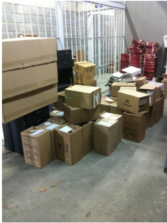
Fotografías estado del Archivo de la CMP después del traslado desde la sede del Aeropuerto Matecaña

Como consecuencia de la mala disposición del material documental, se estaba presentando deterioro del mismo y dificultades al momento de ubicar los documentos que se hubieran requerido al igual que incumplimiento de las normas mínimas de disposición y conservación de archivo.